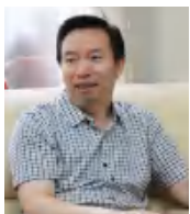
郭本敏 中央新影集团 副总裁 总编辑