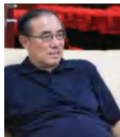
赵东鸣 北京市关心下一代 工作委员会副主任 北京市新闻出版广 电局专家审委