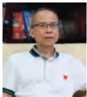
涂晓东 国家体育总局宣传 室司长